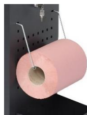
Dérouleur porte-rouleau essui tout