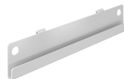
Rail support bacs à bec