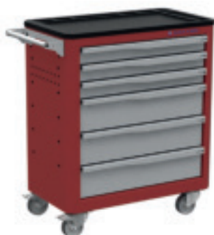
RAL 3000 RV/GC