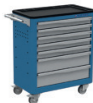
RAL 5015 BI/GC

* Tous les accessoires sont disponibles en gris clair RAL 7035 GC