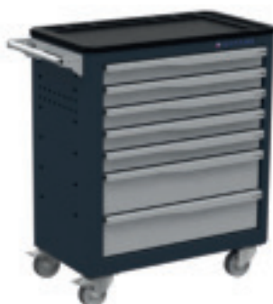
RAL 7016 GA/GC